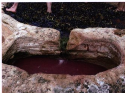
Lagares rupestres. S.V. Sonsierra. La Rioja. 2015