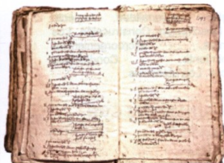
1535. CENSO DE CARLOS V.